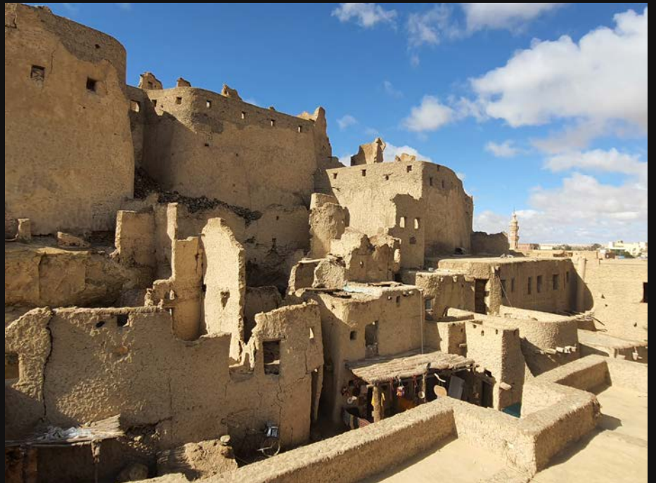
إلى أسفل اليمين