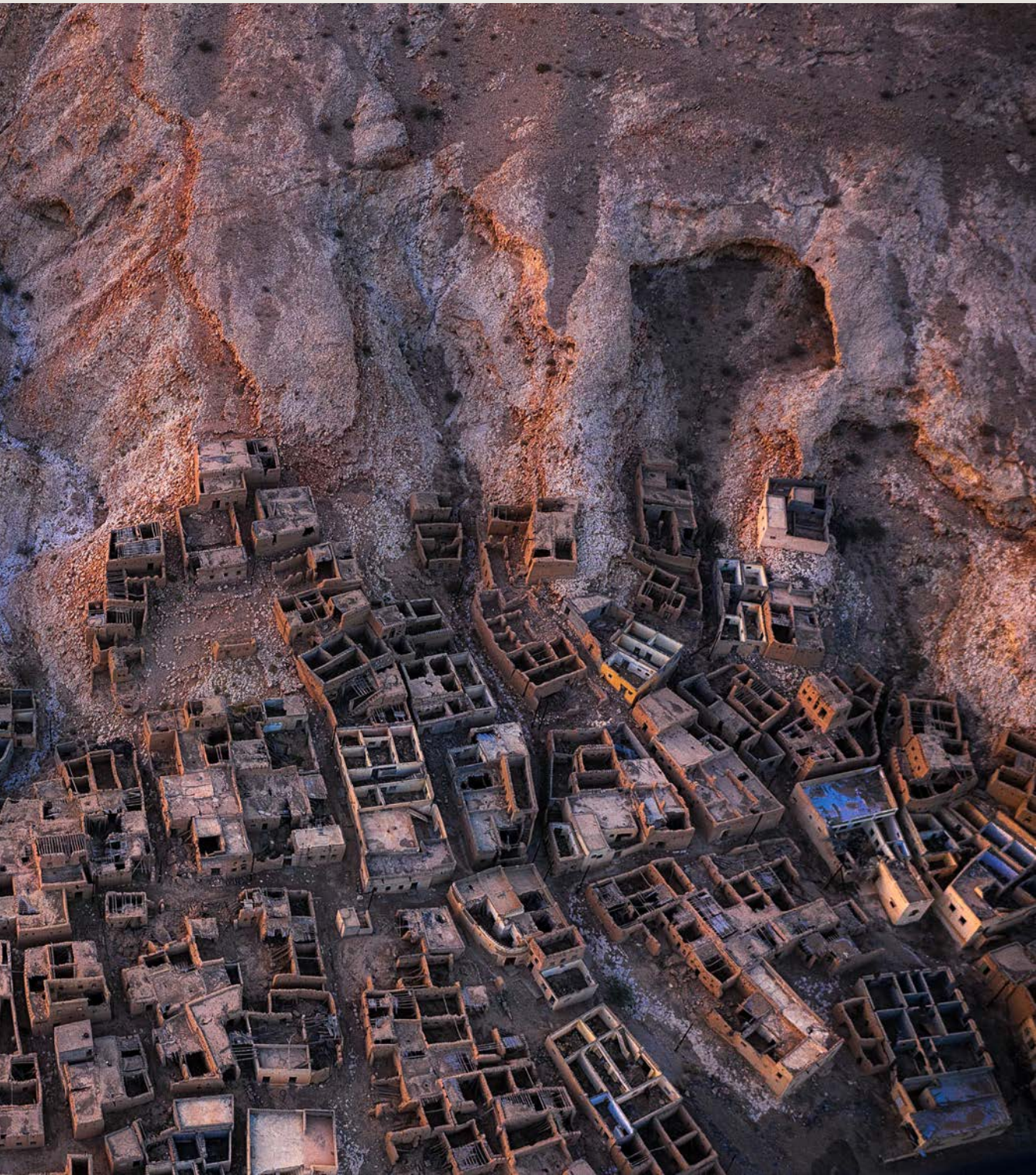
حارة الرمل - عمان