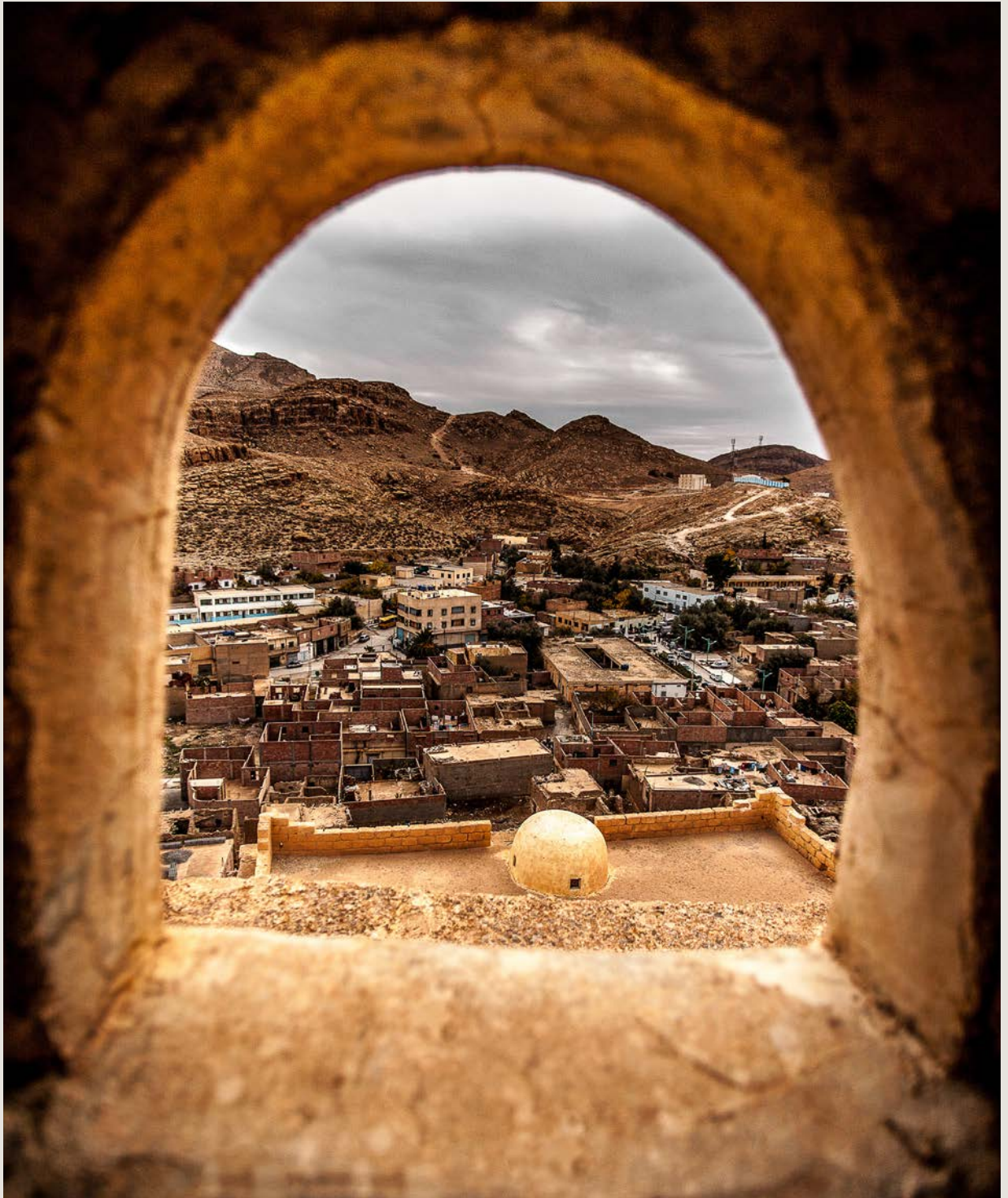
غرداية الجزائر