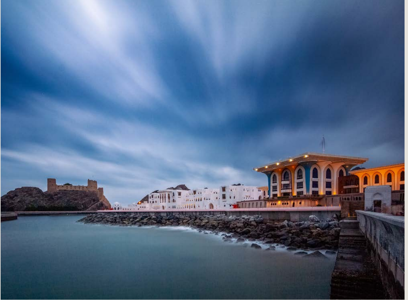
مسقط - عمان