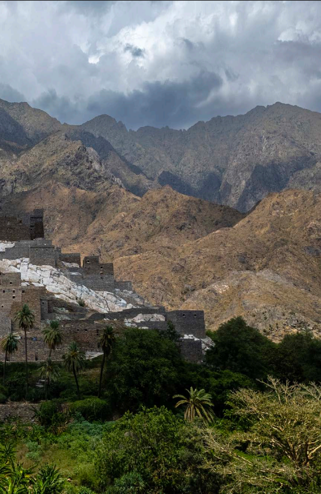
الباحة - السعودية