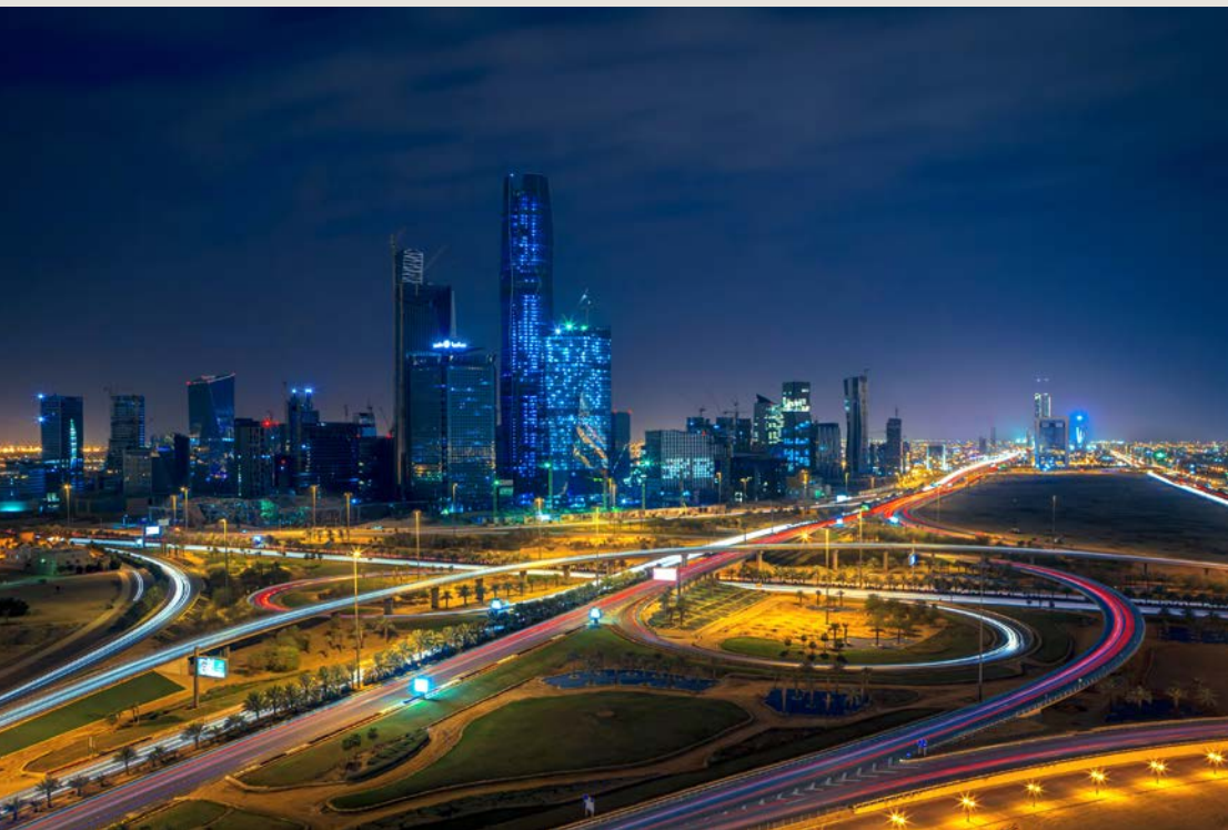
الرياض - السعودية